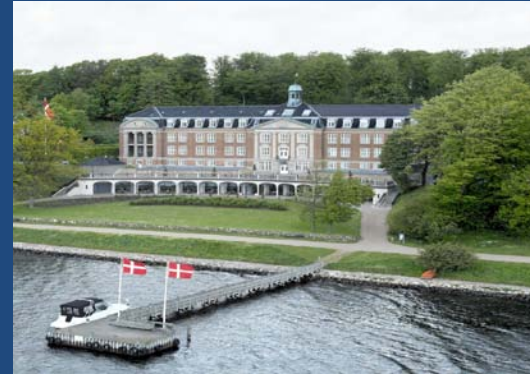
Tidligere tuberkulosesanatorium (1911-1960)