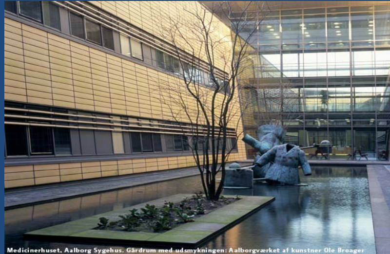
Medicinerhuset, Aalborg Sygehus. Gårdrum med udsmykningen: Aalborgværket af kunstner Ole Broager