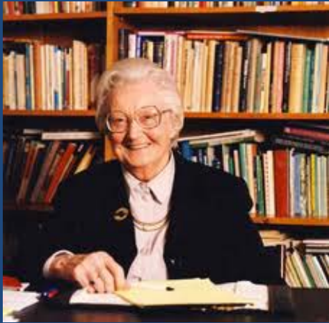
Cicely Saunders (1918-2005)